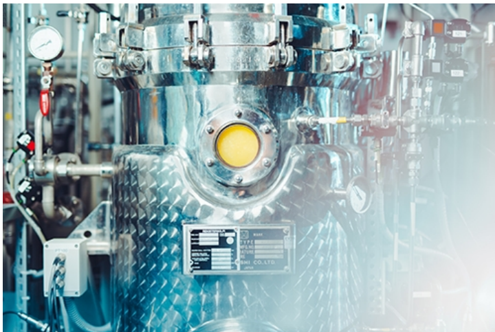
Soleiini - ilmasta peräisin oleva proteiini

- Tiimi. Pääomasijoittajille tiimi merkitsee usein tuotetta enemmän. Sellainen tiimi on hyvä, jossa on ihmisiä ja osaamista täysin eri aloilta, vaikkapa tiedettä, taidetta ja tekniikkaa. Kasvuyritystä on lisäksi vaikea rakentaa jo olemassa olevan toimialan sisälle, vaan se innovaatio ja kasvuprosentit löytyy enemmän eri toimialojen reunoilta ja saumakohtista.